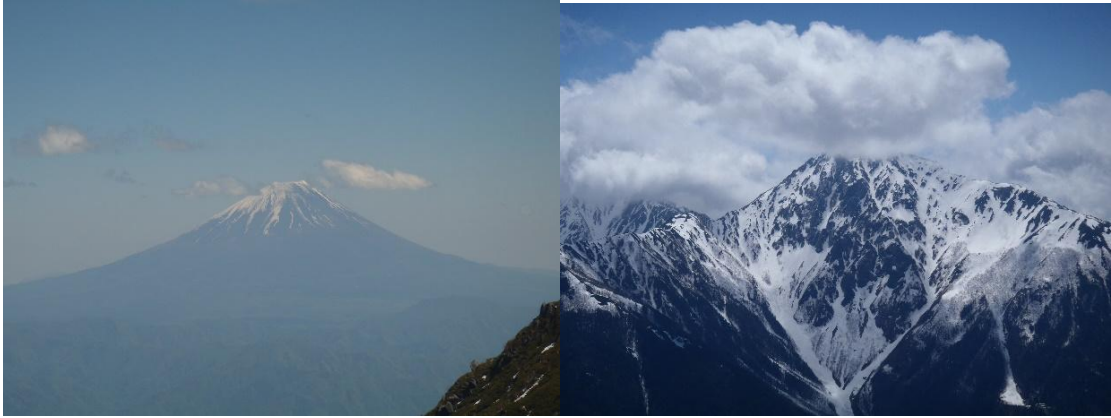
観音岳からの富士山と北岳