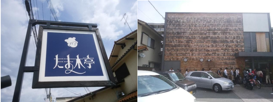
京大宇治キャンパス前のたまき亭（思ったほど高くなかった）